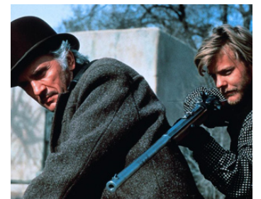
1988 YOUNG GUNS (Young Guns) de Christopher Cain avec Kiefer Sutherland