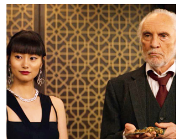
2019 MURDER MYSTERY de Kyle Newachek avec Shioli Kutsuna