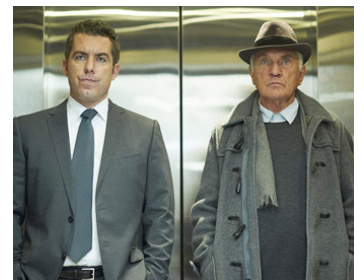
2013 THE ART OF THE STEAL (The Art of the Steal) de Jonathan Sobol avec Dax Ravina