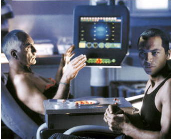
2000 PLANÈTE ROUGE (Red Planet) d'Anthony Hoffman avec Benjamin Bratt