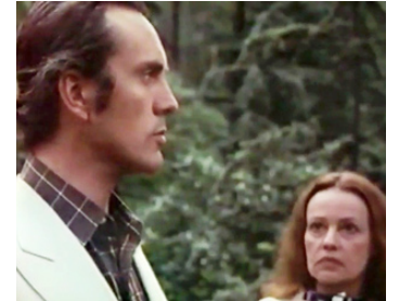
1975 HU-MAN de Jérôme Laperrousaz avec Jeanne Moreau