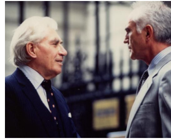
1996 TIRÉ À PART de Bernard Rapp avec Frank Finlay