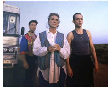
1994 PRISCILLA, FOLLE DU DÉSERT (Priscilla) de Stephan Elliott avec Guy Pearce, H. Weaving