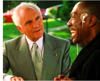
1999 BOWFINGER, ROI D'HOLLYWOOD (Bowfinger) de Frank Oz avec Eddie Murphy