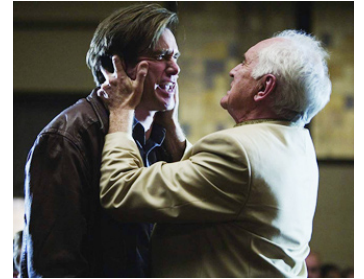
2009 YES MAN (Yes Man) de Peyton Reed avec Jim Carrey