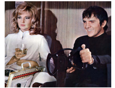
1966 MODESTY BLAISE (Modesty Blaise) de Joseph Losey avec Monica Vitti