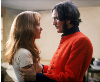
1967 LOIN DE LA FOULE DÉCHAÎNÉE (Far from the madding crowd) de J. Schlesinger avec J. Christie