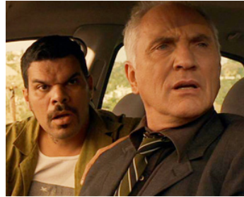
1998 L'ANGLAIS (The Limey) de Steven Soderbergh avec Luis Guzman