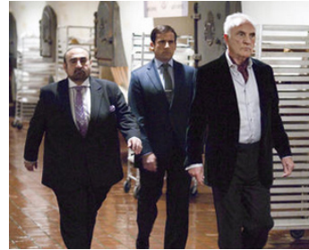
2008 MAX LA MENACE (Get Smart) de Peter Segal avec Ken Davitian, Steve Carel