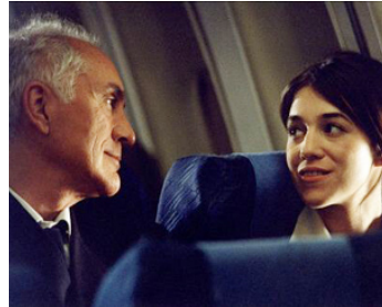
2001 MA FEMME EST UNE ACTRICE d'Yvan Attal avec Charlotte Gainsbourg