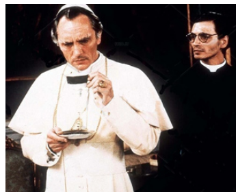
1980 MEURTRE AU VATICAN (Morte in Vaticano) de Marcello Aliprandi avec Fabrizio Bentivoglio