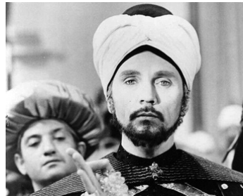
1978 LE VOLEUR DE BAGDAD (The Thief of Bagdad) de Clive Donner