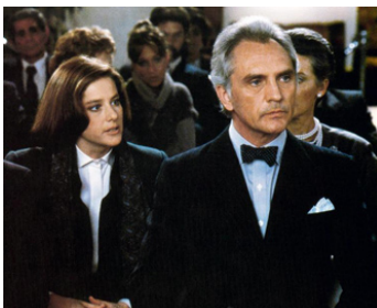
1986 L'AFFAIRE CHELSEA DEARDON (Legal Eagles) d'Ivan Reitman avec Debra Winger