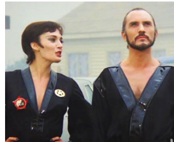
1978 SUPERMAN (Superman) de Richard Donner avec Sarah Douglas