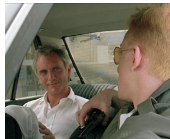
1983 THE HIT, LE TUEUR ÉTAIT PRESQUE PARFAIT (The Hit) de S. Frears avec Tim Roth