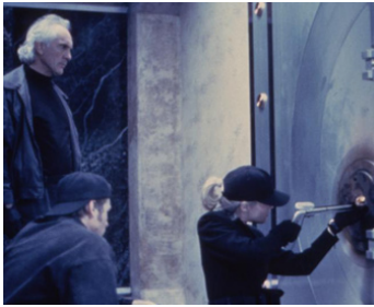
1993 L'AFFAIRE KAREN MCCOY (The Real McCoy) de R. Mulcahy avec Val Kilmer, Kim Basinger