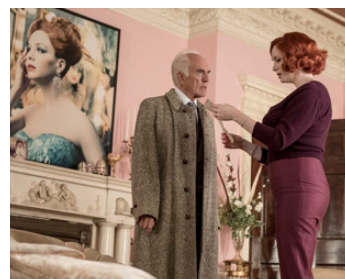
2017 CROOKED HOUSE de Gilles Paquet-Brenner avec Christina Hendricks