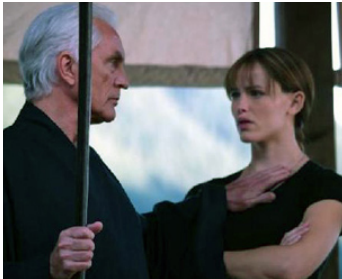
2004 ELEKTRA (Elektra) de Rob Bowman avec Jennifer Garner