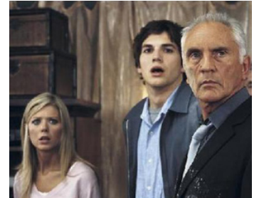
2003 MON, SA FILLE ET MOI (My Boss's Daughter) de D. Zucker avec Tara Reid, Ashton Kutcher