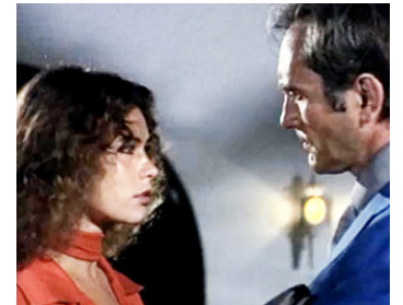
1978 STRIPTEASE (Striptease) de German Lorente avec Corinne Cléry