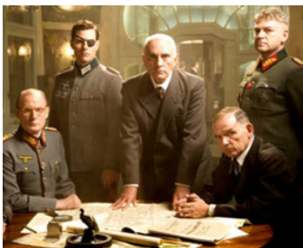
2009 WALKYRIE (Valkyrie) de Bryan Singer avec Tom Cruise, Kenneth Branagh