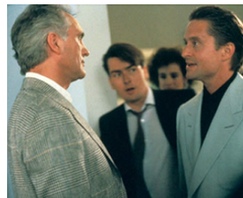
1987 WALL STREET (Wall Street) d'Oliver Stone avec Charlie Sheen, Michael Douglas