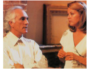
1997 AU-DELÀ DU DÉSIR (Bliss) de Lance Young avec Sheryl Lee