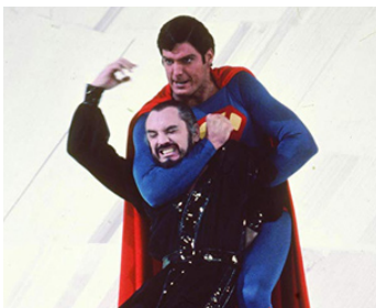
1980 SUPERMAN 2 (Superman 2) de Richard Lester avec Christopher Reeve