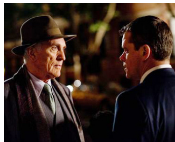
2011 L'AGENCE (The Adjustment Bureau) de George Nolfi avec Matt Damon