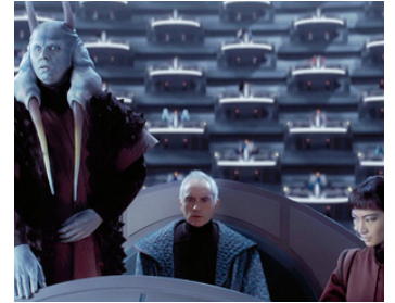
1999 STAR WARS, LA MENACE FANTÔME (The Phantom Menace) de George Lucas