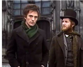
1971 UNE SAISON EN ENFER (Una Stagione all'inferno) de Nelo Risi avec J.-C. Brialy