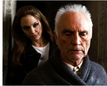
2008 WANTED, CHOISIS TON DESTIN (Wanted) de Timur Bekmanbetov avec Angelina Jolie