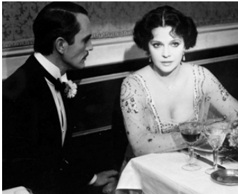
1975 DIVINE CRÉATURE (Divina Creatura) de G. Patroni Griffi avec Laura Antonelli