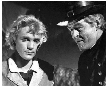
1962 BILLY BUDD (Billy Budd) de Peter Ustinov avec Robert Ryan