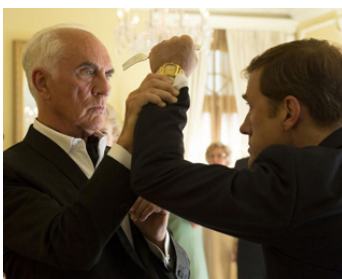
2014 BIG EYES (Big Eyes) de Tim Burton avec Christophe Waltz