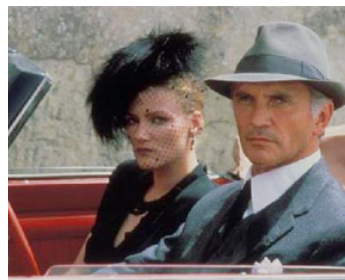
1987 LE SICILIEN (The Sicilian) de Michael Cimino avec Barbara Sukowa