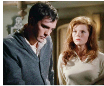
1965 L'OBSÉDÉ (The Collector) de William Wyler avec Samantha Eggar